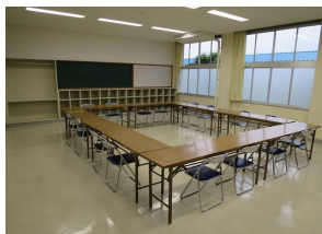
センター会議室 (30名程)