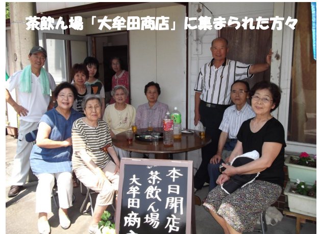
茶飲ん場「大牟田商店」に集まれた方々

※NPO法人ハートムでは、毎週月曜日、午後8時から午後10時まで「こころの電話相談」と称する電話相談業務を実施しています。詳しくは、お問合せ先まで。