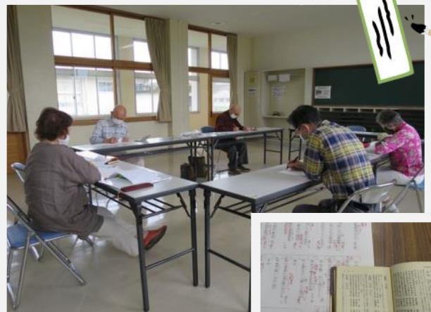
からくに句会さん