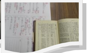
今回は夏の季語で一句!