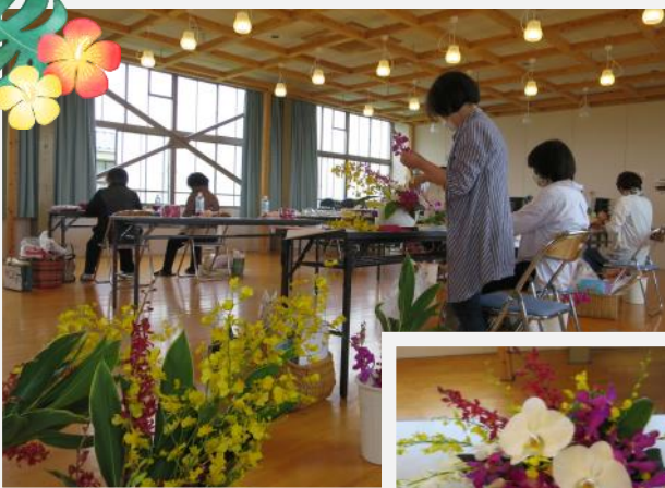
フラワーサークル星の華さん