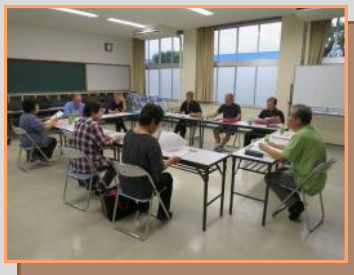
センター会議室（30名程度）

センターに登録されている団体はどなたでも無料でご利用できます。会議棟は体操もOK！